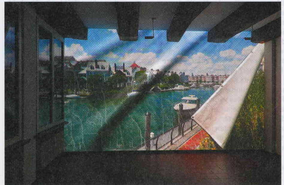
Susanne Hofer · Port Liberté, Video HD, loop, ohne Ton, 2015, Installationsansicht